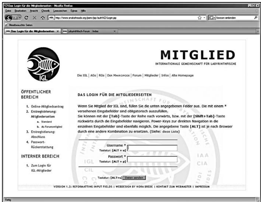
Abbildung 4: Einstiegs-URL in die Mitgliederseiten:

http://www.snakeheads.org/jserv/jsp/authNZ/Login.jsp