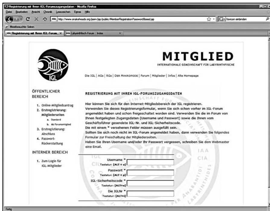
Abbildung 6: Einstiegs-URL Variante 2: http://www.snakeheads.org/jserv/jsp/public/MemberRegistrationPasswordBased.jsp

Haben Sie alle diese Daten an das System abgeschickt, überprüft das System deren Korrektheit. Sollte das System Ihre Daten nicht akzeptiert haben, erhalten Sie eine sprechende Fehlermeldung, die Ihnen hilft, zu verstehen, was falsch gemacht wurde. Im anderen Fall, erhalten Sie eine weitere Eingabemaske. Diese Eingabemaske dient